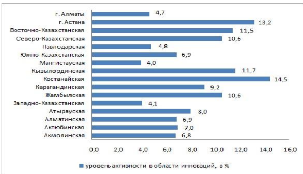
Рисунок 1 - Уровень инновационной активности предприятий по регионам РК за 2016 г. (в %)

Понятие инновационной деятельности неразрывно связано с понятием инновационной активности. По материалам статистического агентства Республики Казахстан инновационная активность предприятий по регионам в 2016 году согласно данным рисунка 1 выглядит следующим образом.