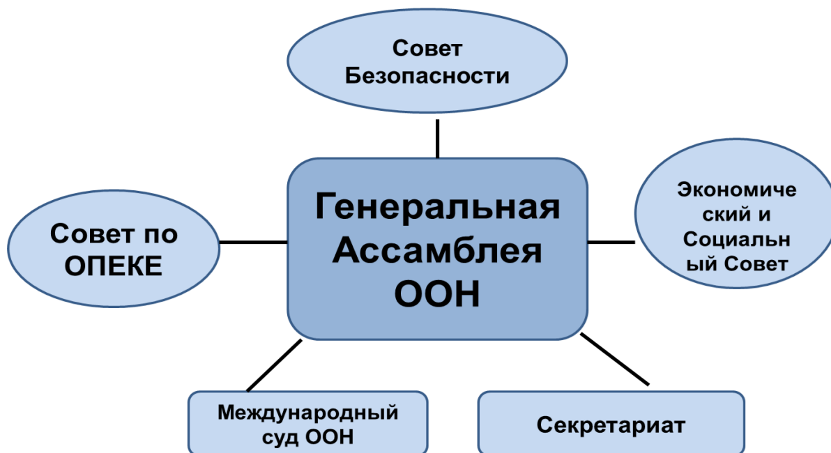
Рисунок 1 – Пример готовой ассоциогаммы Главные органы ООН

Применительно к изучению предметов международного права или любого иностранного языка, проект - это специально организованный преподавателем и самостоятельно выполняемый обучающимися комплекс действий, завершающихся созданием творческого продукта. Проект ценен тем, что в ходе его выполнения, обучающиеся учатся самостоятельно приобретать знания, получать опыт познавательной и учебной деятельности.