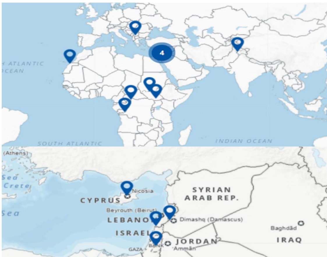
2-сурет - БҰҰ-ның 2025 жылғы белсенді бітімгершілік миссиялары Ескерту – БҰҰ ресми деректері бойынша

"Аш-Шабааб" әлі күнге дейін өзінің идеологиясын насихаттау және жаңа мүшелерді тарту үшін бұқаралық ақпарат құралдарын белсенді қолданады. Террористік топ өзінің медиа қызметін радиостанциялар мен журналдарды қолданудан бастап уақыт өте келе әлеуметтік медиада насихаттау сияқты заманауи байланыс түрлеріне көшкен (Grobelaar, 2022).