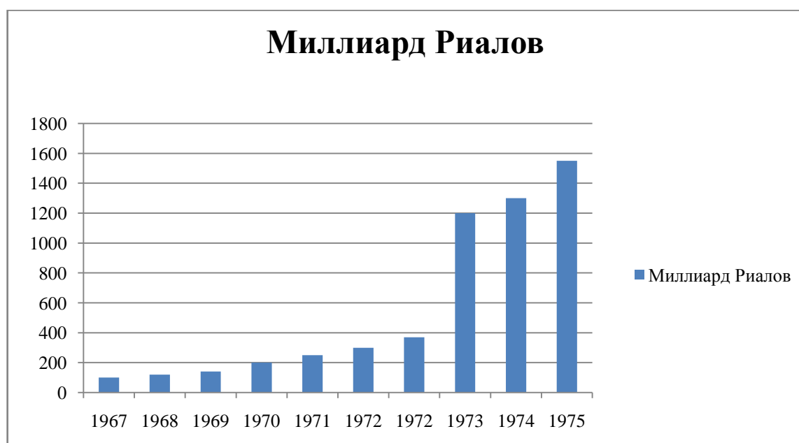
Диаграмма 1 - [4] Увеличение цен на нефть

Анализируя данные таблицы 1 и диаграммы 1, наблюдается увеличение цен на нефть в 1970-е. Прибыль Шаха от продажи нефти с начала 1971 г. до середины 1977 г., увеличилась в 11 раз, с 1870 миллион долларов до 20735 миллион долларов.