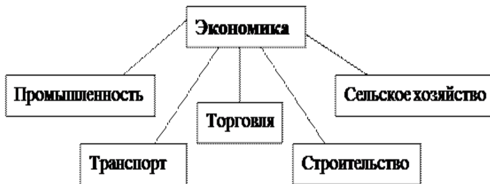
Рисунок 1.1 – Структура экономики

От работы транспорта зависят развитие и нормальное функционирование предприятий промышленности, сельского хозяйства, снабжения и торговли. Велико его значение во внешнеэкономических связях, в деле обороны страны, в освоения новых экономических районов.